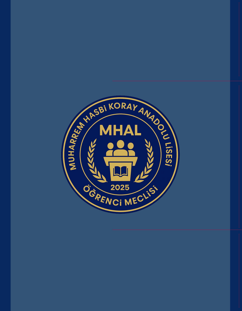
iç sayfa sağ